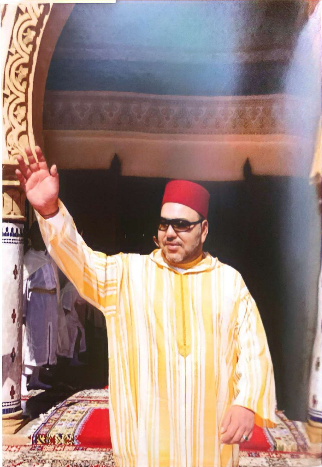
SA MAJESTÉ LE ROI DU MAROC MOHAMMED VI