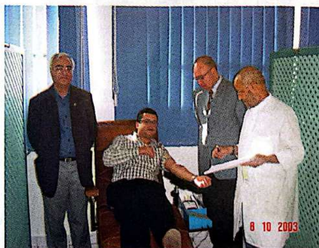
Don du sang