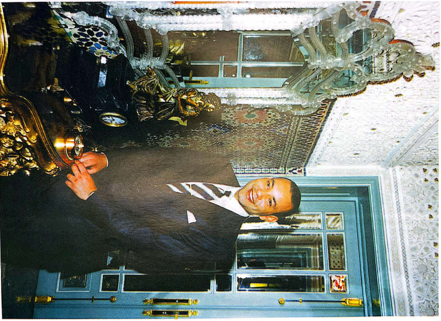
SA MAJESTÉ LE ROI MOHAMMED VI