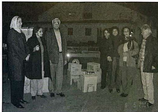
Réception des dons au Port de Tanger.