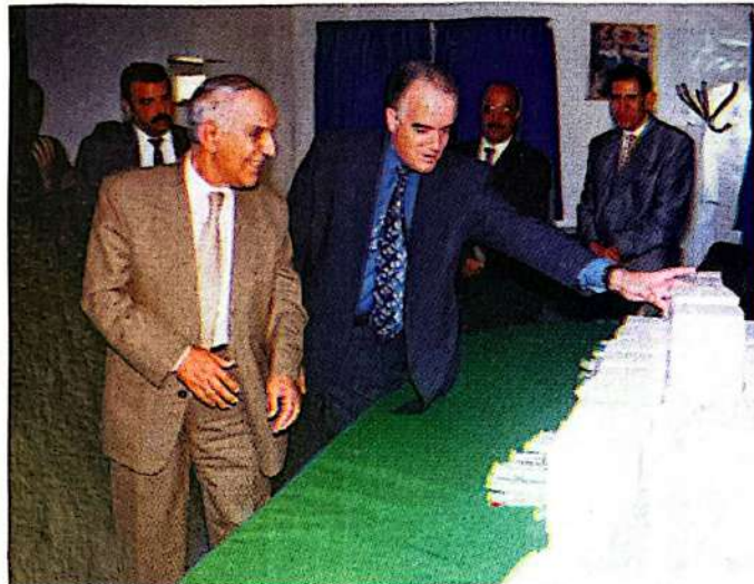
Lions Club Casa Doyen