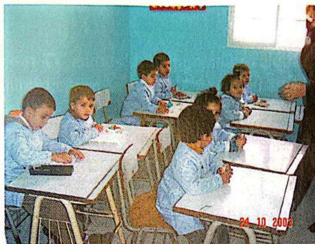
Crèche Tanger 2000