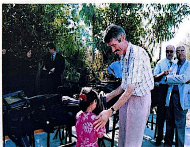
Distribution de Cartables