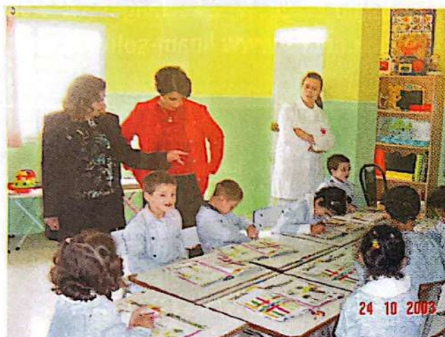
Crèche Tanger 2000

Tanger 2000 Tanger Détroit Tanger Doyen Tanger Montagne Tanger Ibn Batouta Tanger Troisième Millénaire Tétouan Médina