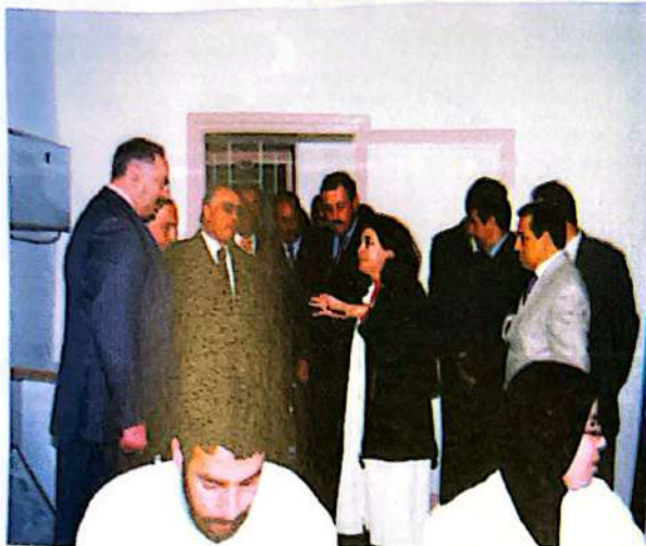
Casa Anfa : Nouveau Centre d'endocrinologie à l'Hôpital Averoes.

Casablanca Les Iris Casablanca Doyen Casablanca Anfa Casablanca Univ Anfa Horizon Casablanca Atlantique