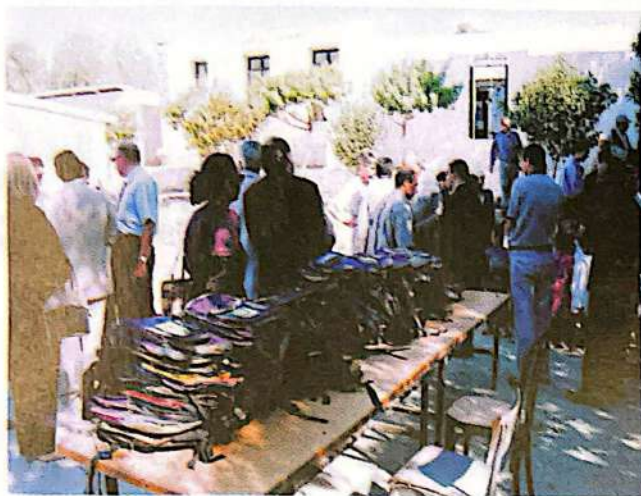
Distribution de Cartables